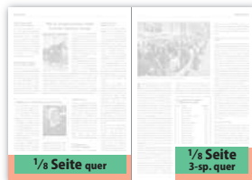
1/8 Seite quer 190 × 32 mm 210 × 45 mm (216 × 48 mm) 1/8 Seite 3-sp. quer 141 × 46 mm 152 × 59 mm (155 × 62 mm)