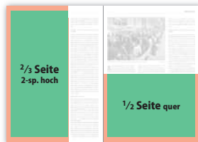
2/3 Seite 2-sp. hoch 124 × 273 mm 135 × 297 mm (138 × 303 mm) 1/2 Seite quer 190 × 135 mm 210 × 148 mm (216 × 151 mm)