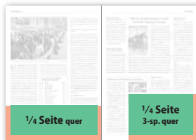
1/4 Seite quer 190 × 65 mm 210 × 78 mm (216 × 81 mm) 1/4 Seite 3-sp. quer 141 × 90 mm 152 × 103 mm (155 × 106 mm)

(zusätzlich 3 mm Beschchnitt an allen Anschnittkanten erforderlich)