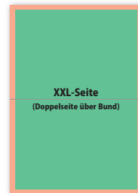
XXL-Seite (Doppelseite über Bund) 273 × 400 mm 297 × 420 mm (303 × 426 mm)