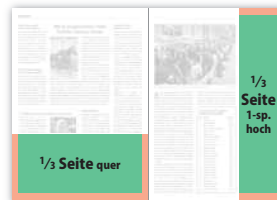
1/3 Seite quer 190 × 90 mm 210 × 103 mm (216 × 106 mm) 1/3 Seite 1-sp. hoch 59 × 273 mm 70 × 297 mm (73 × 303 mm)