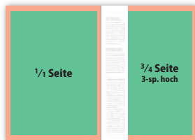
1/1 Seite 190 × 273 mm 210 × 297 mm (216 × 303 mm) 3/4 Seite 3-sp. hoch 141 × 273 mm 152 × 297 mm (155 × 303 mm)