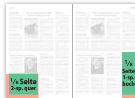
1/8 Seite 2-sp. quer 92 × 65 mm 103 × 78 mm (106 × 81 mm) 1/8 Seite 1-sp. hoch 43 × 135 mm 54 × 148 mm (57 × 151 mm)