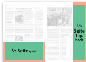
1/3 Seite quer 190 × 90 mm 210 × 103 mm (216 × 106 mm) 1/3 Seite 1-sp. hoch 59 × 273 mm 70 × 297 mm (73 × 303 mm)

■ = Satzspiegelformat ■ = Anschnittformat (zusätzlich 3 mm Beschnitt an allen Anschnittkanten erforderlich)