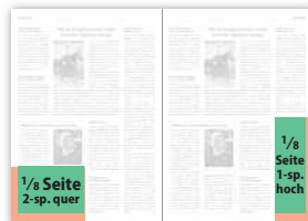
1/8 Seite 2-sp. quer 92 × 65 mm 103 × 78 mm (106 × 81 mm) 1/8 Seite 1-sp. hoch 43 × 135 mm 54 × 148 mm (57 × 151 mm)