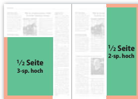
1/2 Seite 3-sp. hoch 141 × 182 mm 152 × 195 mm (155 × 198 mm) 1/2 Seite 2-sp. hoch 92 × 273 mm 103 × 297 mm (106 × 303 mm)