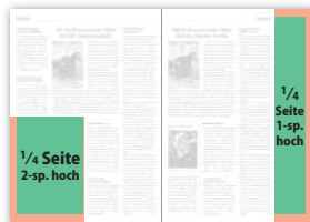
1/4 Seite 2-sp. hoch 92 × 135 mm 103 × 148 mm (106 × 151 mm) 1/4 Seite 1-sp. hoch 43 × 273 mm 54 × 297 mm (57 × 303 mm)