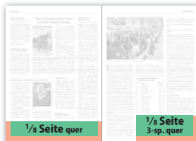
1/8 Seite quer 190 × 32 mm 210 × 45 mm (216 × 48 mm) 1/8 Seite 3-sp. quer 141 × 46 mm 152 × 59 mm (155 × 62 mm)